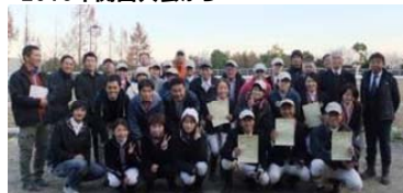
社会人から始めてもご覧の通り、見事な騎乗姿