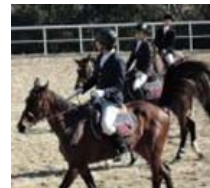
社会人デビューで初の競技会！ 部員も格好良いでしょ？