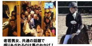
老若男女、共通の話題で盛りあがるのは馬のおかげ！