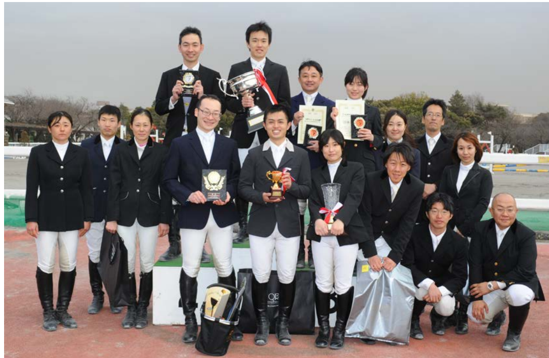
【入賞チーム選手のみなさん】