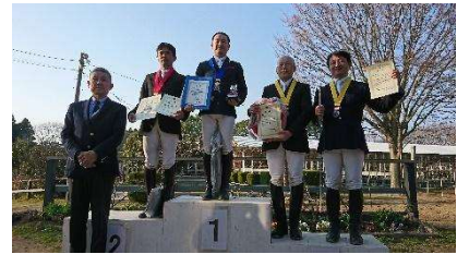
<全日本社会人馬術選手権大会>

当連盟は、会員団体及びその部員に向けた「全日本社会人馬術選手権大会」「全日本実業団障害馬術大会」、「JBG ホースフェスティバル」をはじめとする競技会の開催のほか、一般競技者向けに「キャロットステークス」を主催しており、また、国際大会としては日本と韓国で交互に開催される「日韓社会人親善馬術大会」を開催しています。このほか、馬術講習会や技能認定審査会、乗馬会ボランティア等を実施しております。これらの事業の企画立案、運営には、各会員団体の中から選出された理事および委員が中心となってあたっています。