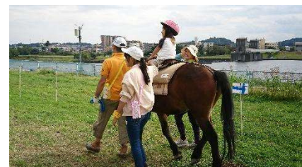
<乗馬会ボランティア>