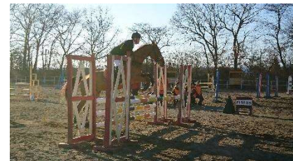
<全日本実業団障害馬術大会>