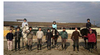
<中上級馬場馬術講習会>